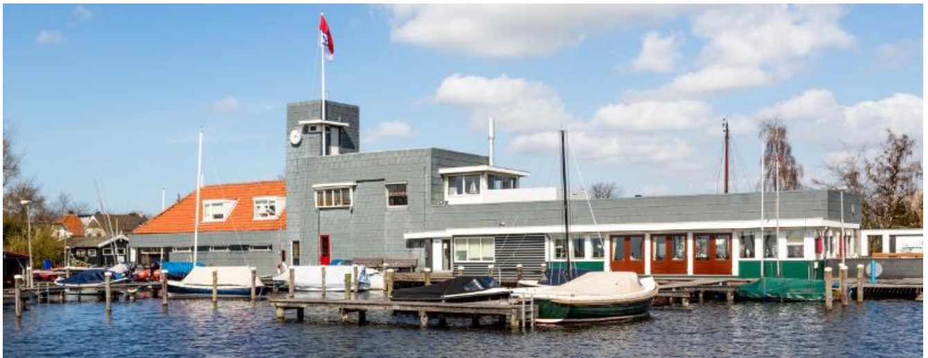
Havengebouw gezien vanaf het water

Dit Rapport Borgstelling geeft inzage in de uitgangspunten op basis waarvan SWS de financiële haalbaarheid van de investering- en financieringsplannen als positief heeft beoordeeld. De door aanvrager beschikbaar gestelde informatie is door SWS aangevuld en verwerkt tot dit rapport. Naast openbare bronnen maakt SWS hierbij gebruik van de kennis en informatie uit de jaarstukken die jaarlijks worden ontvangen van meer dan 1.400 sportorganisaties uit ruim 30 verschillende sportdisciplines. Ondanks dat dit met de grootste zorgvuldigheid is gedaan wil SWS benadrukken dat aan dit rapport geen rechten kunnen worden ontleend. SWS aanvaardt geen enkele aansprakelijkheid voor schade die het gevolg is van onjuistheid of onvolledigheid (in de meest ruime zin des woord) in dit rapport. Noch SWS, noch de staf of medewerkers zijn aansprakelijk voor directe, bijkomende of gevolgschade, dan wel indirecte schade.