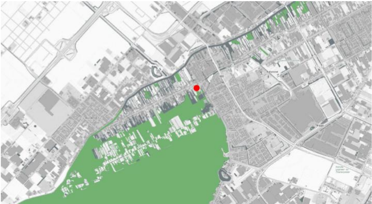
NNN-zone en het plangebied (rode stip)

Het plangebied (landstrip) maakt geen deel uit van het NNN. Het ligt wel tegen de NNN-zone van de Kleine poel, onderdeel van de Westeinderplassen. Dit deel van het NNN is voor de omgeving belangrijk als een verbindingszone tussen diverse watersystemen en gebieden. De werkzaamheden hebben echter geen enkel negatief effect op de functie en doelstellingen van die zone. Derhalve heeft hierop verder geen toetsing plaatsgevonden.