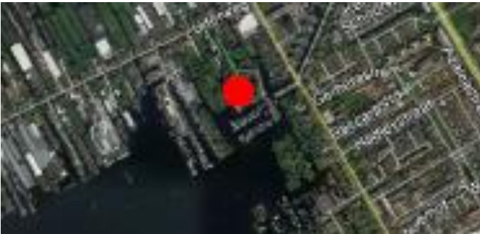
Plangebied (bij benadering)

U heeft Bureau Natuurzorg gevraagd het perceel Uiterweg 13A te Aalsmeer, hierna te noemen plangebied, een flora en fauna inventarisatie te doen op mogelijk aanwezige beschermde soorten en hun habitat. U bent voornemens de herinrichtingswerkzaamheden af te ronden. Het veldbezoek vond plaats op 22 juli 2025. De inventarisatie is gedaan in de vorm van een scan Omgevingswet Natuur die is ingegaan op 1 januari 2024.